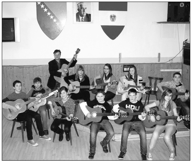
Sa jednog časa: Bit će nasljednika

Povodom tragedije reagirali su brojni njemački političari, među kojima i predsjednik države Horst Keler (Keller) te kancelarka Angela Merkel koja je istakla da je ovakav zločin neshvatljiv. U četvrtak su širom Njemačke zastave bile spuštene na pola koplja kao znak žalosti.