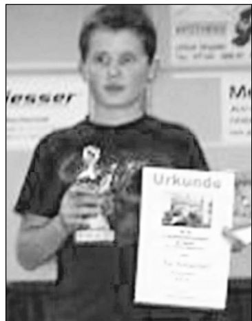
Krečmer: Unaprijed odabrao učionice