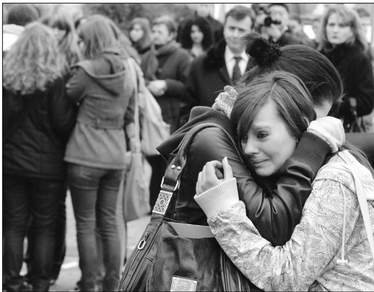
Tuga i nevjerica učenika